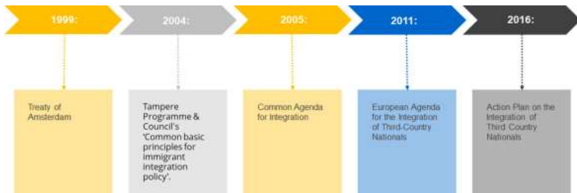
Εικόνα 2: Βασικές ημερομηνίες για την ανάπτυξη μιας ευρωπαϊκής πολιτικής απάντησης της ΕΕ στον τομέα του ασύλου και της μετανάστευσης

Η ΕΕ έχει θέσει προτεραιότητες και στόχους για την προώθηση των πολιτικών της ΕΕ, των νομοθετικών προτάσεων και των ευκαιριών χρηματοδότησης. Ένα χρονοδιάγραμμα των πιο σημαντικών βημάτων για την ανάπτυξη μιας πολιτικής απάντησης στην εισροή μεταναστών και προσφύγων σε ευρωπαϊκό επίπεδο παρουσιάζεται παρακάτω.